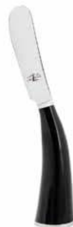
CB BN BURE